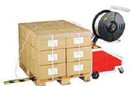
Cercleuse verticale semi-automatique MCA014