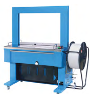
Cercleuse automatique MCA013