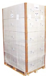
Palette de 52 ou 60 bobines