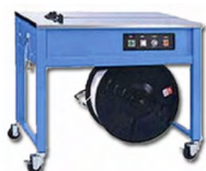
Cercleuse semi-automatique MCA010