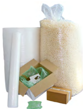
Produits de calage