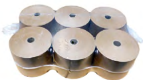
Blister de 12 rouleaux