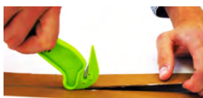
Cutter de sécurité BSCUT01