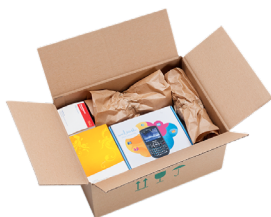
Produit de calage