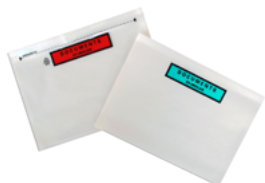
Pochette adhésive d'expédition