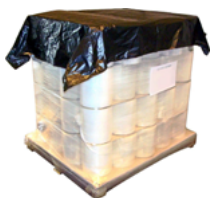
Coiffe de protection