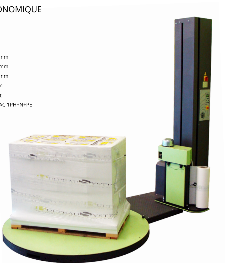
Châssis + Plateau tournant d'une hauteur de 86 mm